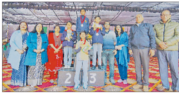
रेवाड़ी। खेल प्रतियोगिताओं के विजेता अतिथियों के साथ।