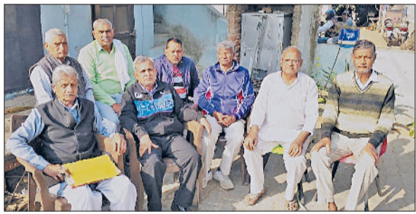
रेवाड़ी। बैठक में उपस्थित राजपूत सभा के सदस्य।