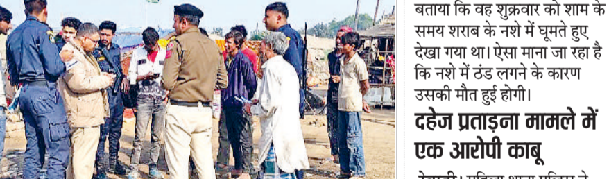
रेवाड़ी। अभियान के दौरान लोगों के पहचान पत्र चक करती पुलिस।

कौशलों में निपुण हो। नई शिक्षा नीति के तहत नए भारत का प्रत्येक बच्चा हुनरमंद होगा। छात्र आत्मनिर्भर बनेंगे और रोजगारपरक कौशल सीखेंगे। अध्यापकों को इस लिए अपडेट करना जरूरी है। डाइट प्राचार्य ने कहा कि वोकेशनल शिक्षा से छात्रों में आत्मविश्वास बढ़ेगा और छात्र पढ़ाई के साथ हुनर भी सीखेंगे।