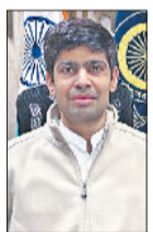
डीसी अभिषेक मीणा।

डीसी अभिषेक मीणा ने जिले के किसानों से प्रधानमंत्री फसल बीमा योजना यानि पीएमएफबीवाई का लाभ लेने के लिए रबी फसलों का बीमा करवाने का आह्वान किया है। पीएमएफबीवाई के तहत 2025-26 के लिए रबी की फसलों का बीमा कराने की अंतिम तिथि 31 दिसंबर निर्धारित की गई है। डीसी मीणा ने बताया कि प्रधानमंत्री फसल बीमा योजना के तहत मौजूद 2025-26 रबी सीजन में गेहूँ, चना, सरसों, जौ और सूरजमुखी फसलों का बीमा किया जा रहा है। किसान की ओर से रबी फसलों का देय प्रीमियम बीमित