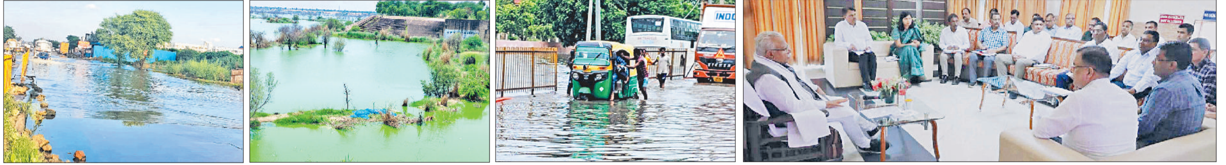
रेवाड़ी। धारुहेड़ा क्षेत्र में सड़क पर जमा दूषित पानी, साहबी नदी में जमा दूषित पानी, धारुहेड़ा-भिवंडी बार्डर पर दूषित पानी में से निकलते वाहन तथा जुलाई 2023 में दूषित पानी की समस्या को लेकर अधिकारियों की बैठक लेते पूर्व सीएम मनोहर लाल। फाईल फोटो।

समाधान के नाम पर मिले आश्वासन, धरातल पर नहीं हुआ काम