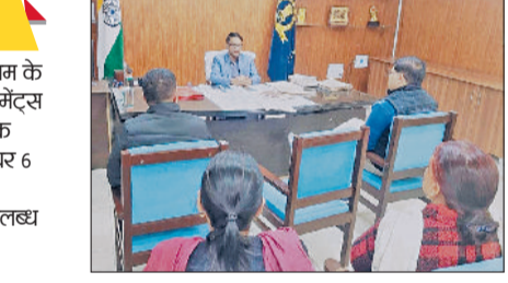
रेवाड़ी। अधिकारियों की बैठक लेते हुए एसडीएम।

एसडीएम ने बताया कि एनीमिया की रोकथाम के लिए सभी लाभार्थी समूहों को आयरन सप्लीमेंट्स उपलब्ध कराए जा रहे हैं। उन्होंने बताया कि एनएमओ डा. सोमा यादव के दिशा निर्देश पर 6 माह से 59 माह तक के बच्चों को आधा कार्यकर्ताओं की ओर से आयरन सिरप उपलब्ध कराया जा रहा है। सभी सरकारी एवं निजी स्कूलों की कक्षा एक से कक्षा पांच तक के विद्यार्थियों को आयरन की पिंक गोली साप्ताहिक रूप से हर बुधवार को दी जा रही है, वहीं सरकारी स्कूलों में कक्षा 6 से 12 तक के विद्यार्थियों को आयरन की नीली गोली दी जा रही है। अन्य लाभार्थी समूहों को आयरन की लाल गोली उपलब्ध कराई जा रही है।