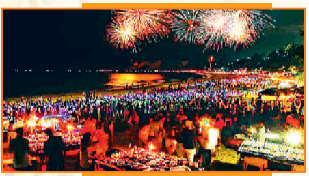
बैंगलुरु तारों की छांव में संगीतमय विदाई: हाल के वर्षों

जिंदगी को कुछ और ही रहस्यमयी रौनक से लबरेज करती है। यहां सिर्फ पार्टियां ही नहीं होतीं, एक ग्लोबल टेवर के साथ नए साल का सेलिब्रेशन भी संपन्न होता है। पुडुचेरी सौम्य-संस्कारों भरी विदाई: जो लोग शांति और सौम्यता में खुशी का एहसास करना चाहते हैं, उनके लिए उपयुक्त जगह है पुडुचेरी। पुडुचेरी भी साल 2025 की विदाई पार्टियों की तैयारी जोर-शोर से पूरी करने में लगा है। फ्रेंच क्वार्टर्स में जैज नाइट्स, आश्रमों में मेडिटेशन संध्या और रॉक बीच पर कैडल-लिट-वॉक, ये सब यहां की न्यू ईयर हलचल को एक अलग ही रंग देते हैं। यहां का जश्न उन लोगों की पहली पसंद होता है, जो साल का स्वागत शोर से नहीं, अपने भीतर की गुंजती शांति और दमकती आभा के साथ करना चाहते हैं।