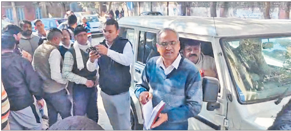
रेवाड़ी। एसीबी की गाड़ी का रास्ता रोकने का प्रयास करते हुए लोग।

देते रहे थे, परंतु इस बीडीपीओ ने कमिशन की राशि बढ़ाकर 10 प्रतिशत कर दी। सवाल यह उठ रहा है कि राजनीतिक रूप से प्रभावी होने के बावजूद शिकायतकर्ता क्यों अधिकारियों को बिल पास कराने की एवज में 2 फीसदी कमिशन देता रहा। सवाल यह भी उठ रहा है कि जब पेंमेंट ठेकेदारों की रुकी हुई थी, तो चेयरमैन के पति को शिकायत की जरूरत क्यों नहीं पड़ी। वह ठेकेदार खुद सामने क्यों नहीं आए, जिनकी पेंमेंट अटकी हुई थी। शिकायतकर्ता का तर्क है कि वह विकासकार्यों के लिए क्लेशर की सप्लाई का कार्य करता है। ठेकेदारों की पेंमेंट रुकने की वजह से उसका पैसा अटका हुआ है, इसलिए उसे इस कार्रवाई को सिरे चढ़ाना पड़ा। चर्चा यह भी है कि ब्लॉक समिति के तहत होने वाले विकासकार्यों में ठेकेदार भी चेयरमैन पति के खास हैं, जिनमें एक परिवार का सदस्य भी शामिल बताया जा रहा है। जानकारों के अनुसार अगर इस मामले की निष्पक्ष जांच होती है, तो दूध का दूध और पानी का पानी होने की पूरी संभावना है।