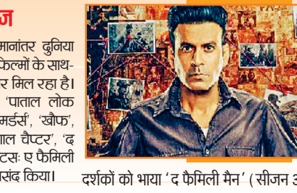
दर्शकों को भाया 'द फैमिली मैन' (सीजन 3)

बीते कुछ वर्षों में एंटरटेनमेंट की एक उमंगान्तर दुनिया विकसित हुई है। इन दिनों थिएटर में रिलीज फिल्मों के साथ-साथ ओटीटी शोज को भी दर्शकों का खूब प्यार मिल रहा है। 'द बैंड्स ऑफ बॉलीवुड', 'ब्लैक वॉटर', 'पाताल लोक (सीजन 2)', 'पंचायत (सीजन 4)', 'मंडला मर्डर्स', 'खौफ', 'स्पेशल ऑप्स (सीजन 2)', 'आका: द बंगल चैप्टर', 'द फैमिली मैन (सीजन 3)' और 'किंगडम जस्टिस: ए फैमिली मैटर' जैसे ओटीटी शोज को दर्शकों ने खूब पसंद किया।